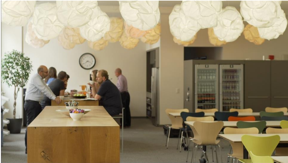
In der Rangliste der Großunternehmen mit mehr als 250 Mitarbeitern hat die Ergon Informatik GmbH 2018 am besten abgeschnitten. Die zahlreichen Gemeinschaftsflächen sind freundlich und gleichzeitig funktional eingerichtet.